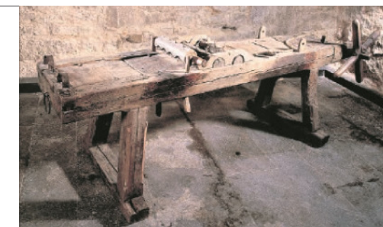
Folterinstrument: Die Streckbank in der Ausstellung im Kriminalmuseum

Es geht in der Schau um Grundsätzliches: Wann konnte man derinert der Hexerei angeklagt werden? Und was ist der Unterschied zwischen Häretikern und Hexen? Wann wurde die Hexerei eigentlich vornehmlich weiblich? Und wieso gab es in den damaligen Zentralstaaten keine oder kaum He-