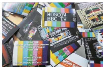
Freunde schicken Uwe Alberti Testbilder aus aller Welt.